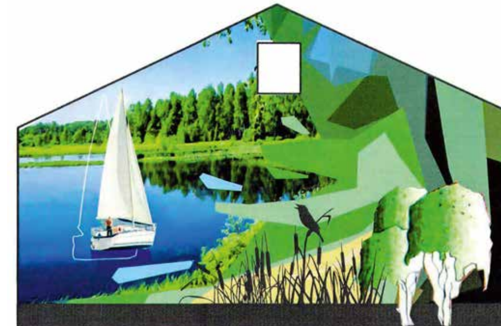
PWC Hainer See: Gestaltungskonzept (Umsetzung bis Herbst 2019)