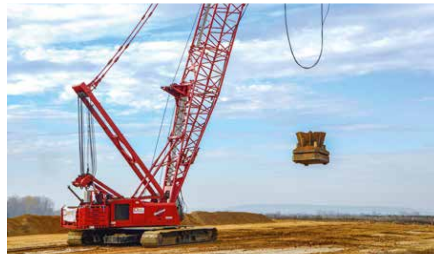
Dynamische Intensivverdichtung 2015