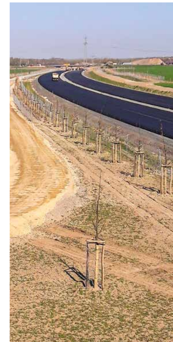
Trassennahe Anpflanzung von Eichen-Hochstämmen