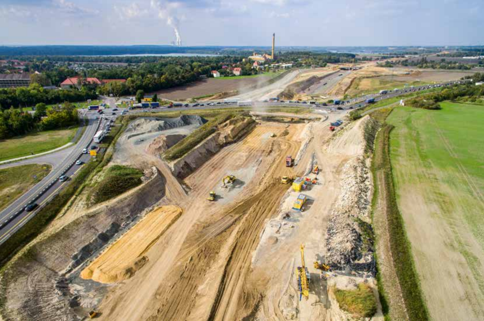
Provisorium am südlichen Bauanfang 2015

Seit August 2013 rollt der Verkehr auf der A 72 vom Bayerischen Vogtland über Chemnitz durchgehend bis Borna. Hier begannen noch 2013 die Arbeiten am letzten noch fehlenden, rund 17 Kilometer langen Bauabschnitt 5 von Borna bis zur Anbindung an die A 38 im Leipziger Süden.