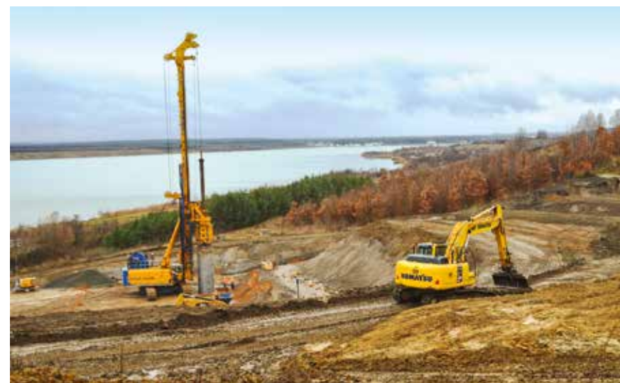
Bodenverbesserung am Hainer See 2016