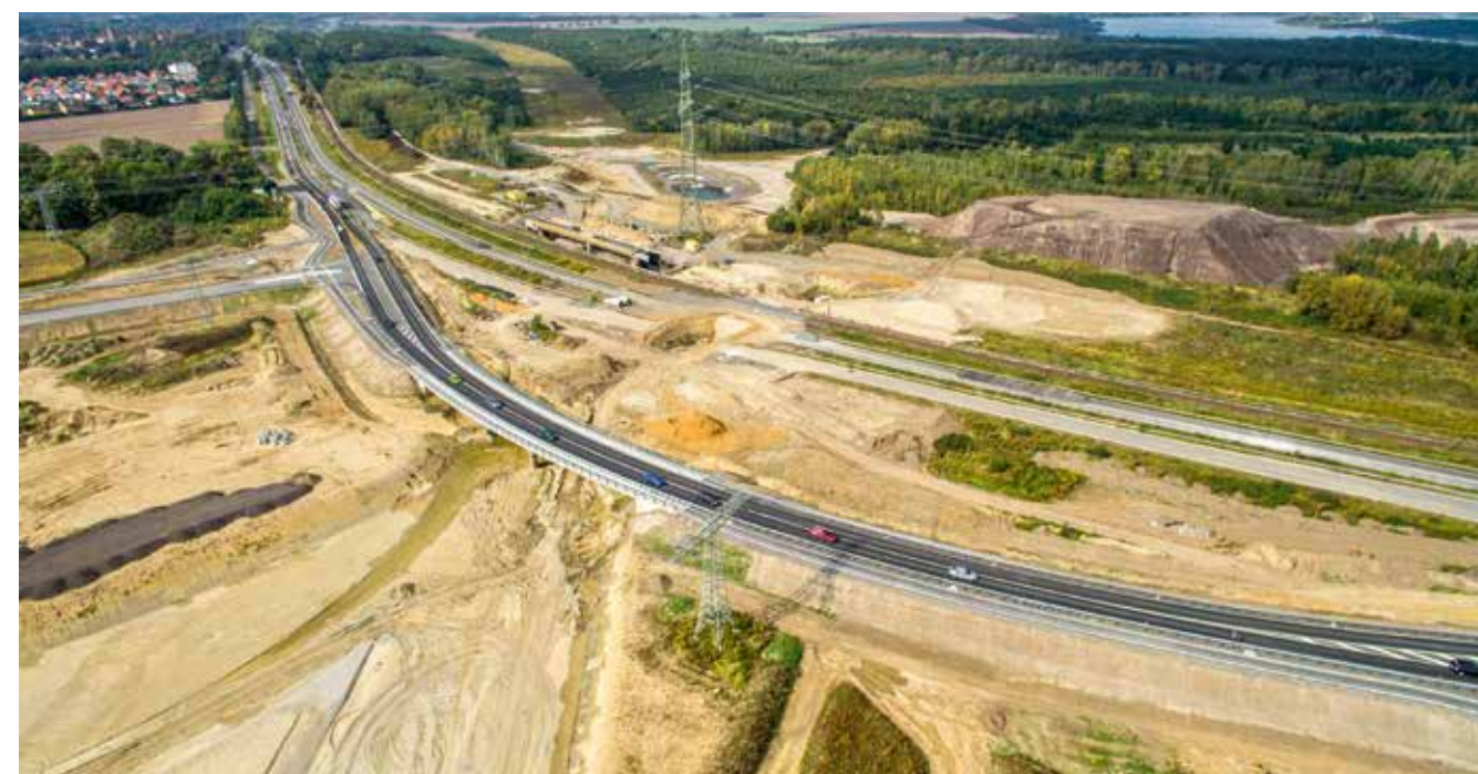
Nördliches Bauende Abschnitt 5.1 Sommer 2017