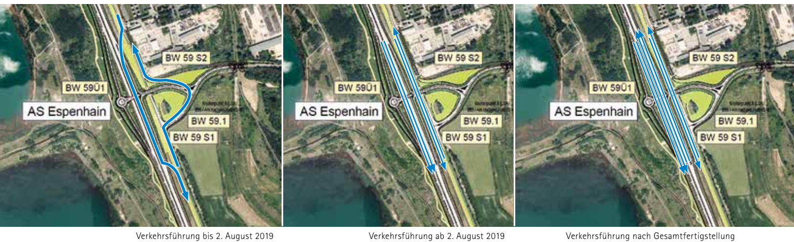
Verkehrsführung bis 2. August 2019