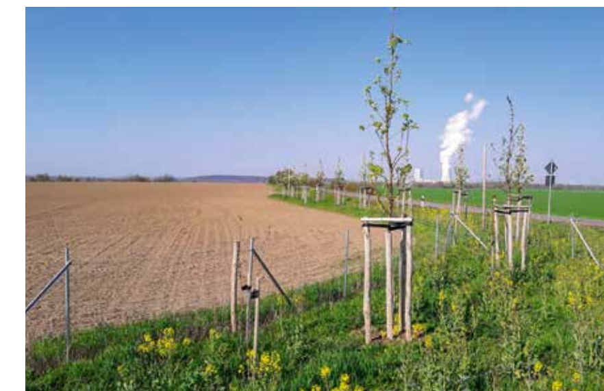
Trassennahe Anpflanzung von Hochstämmen

zuchtanlage Rötha (in Kooperation mit der Stadt), des Stadions »Am Dreieck Borna« oder auch der Gärtnerei Borna wurden und werden abgebrochen und zurückgebaut, landschaftspflegerische Arbeiten und Renaturierungen wie der Eulaue oder des Goldenen Borns haben entlang der Trasse vielerorts neue Kleinode für die Pflanzen- und Tierwelt geschaffen. Auf weiteren 750000 Quadratmetern wurden und werden Randbereiche des neuen A72-Abschnitts begrünt und bepflanzt.